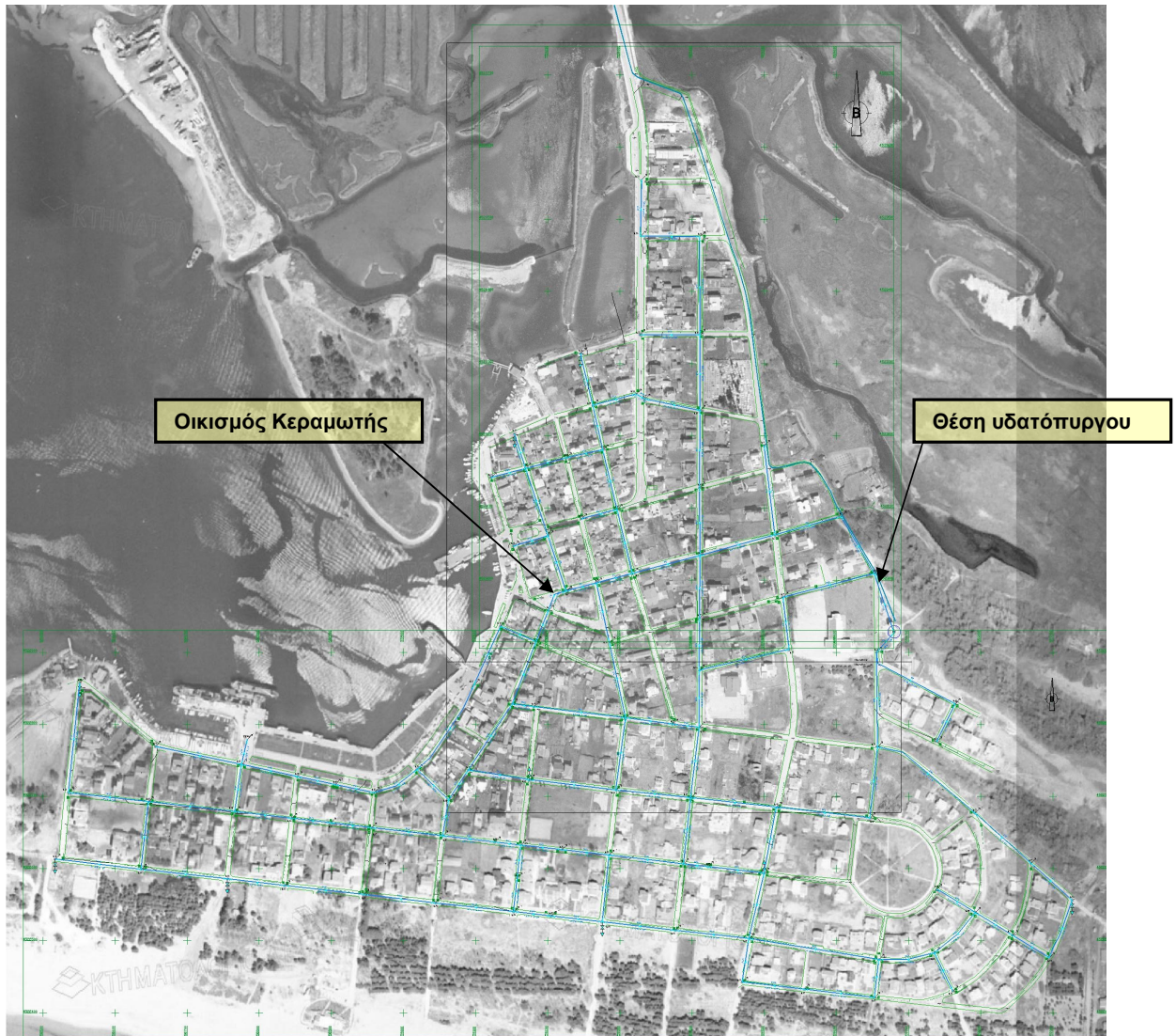
Σχήμα 1. Περιοχή μελέτης – Οικισμός Κεραμωτής